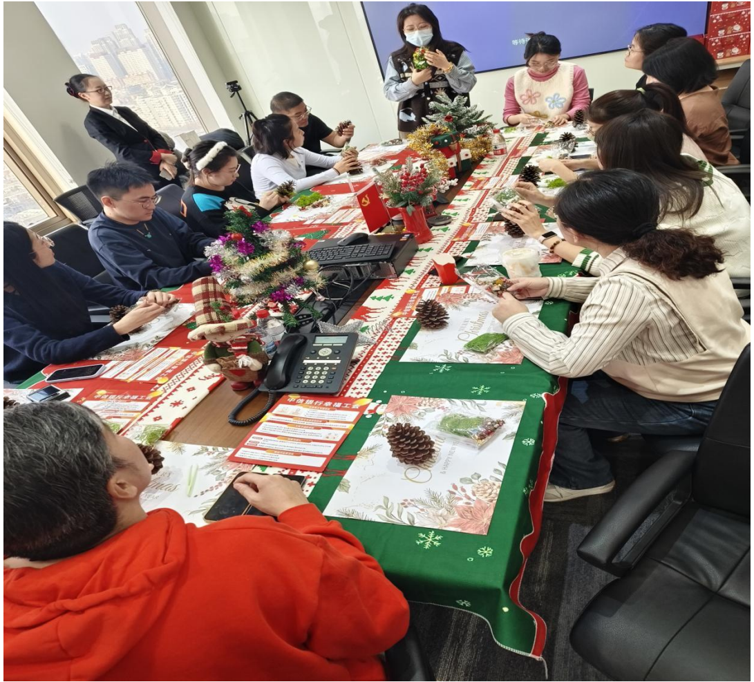
工会组织趣味活动