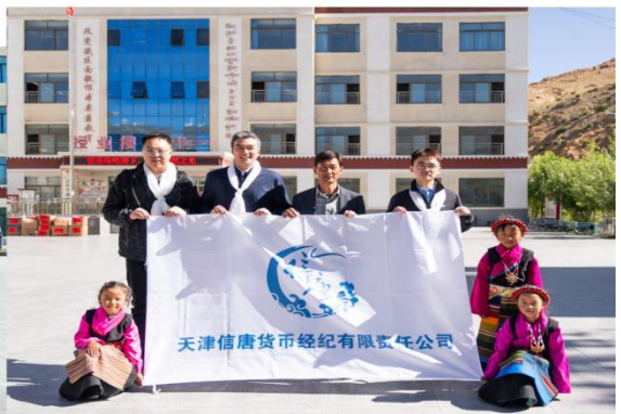
公司赴西藏投身于公益慈善事业