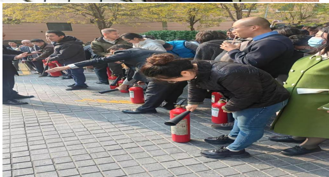
消防知识培训和实操演练