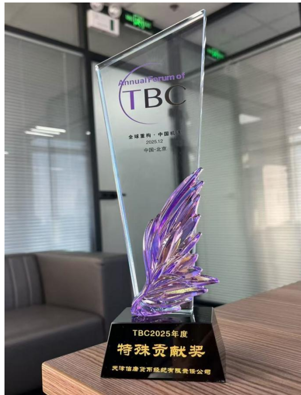
公司获得 TBC2025 年度特殊贡献奖

公司为更好履行社会效益方面责任，公司副总李旭先生代表公司参加以“金融强国与金创区建设——金融+科技：双向赋能金融强国”为主题的 2025 天津五大道金融论坛。论坛聚焦金融和科技双向赋能、相互滋养，深入学习落实习近平总书记关于金融工作重要论述和视察天津重要讲话精神，用足用好一系列存量增量金融政策，在完善科技金融服务体系、提升科技金融服务能级、优化科技金融服务生态上持续用力，实施科创金融服务能力提升专项行动，推动跨界业务场景融合、数据价值共享、技术能力互补，形成具有天